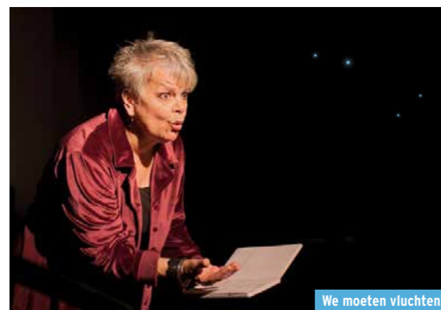
We moeten vluchten!

Via de brochure en aanmeldingsprocedure van Cultuurschakel hebben we veel leerlingen uit het basis-onderwijs in Laaktheater mogen begroeten. In totaal kwamen bijna 5.000 kinderen bij ons op bezoek.