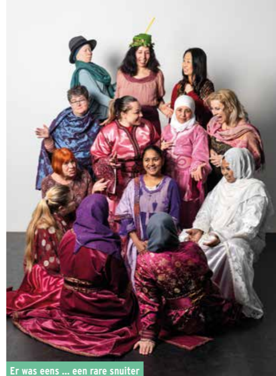
Er was eens ... een rare snuiter