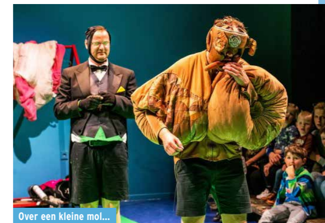
Over een kleine mol...