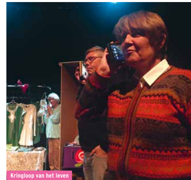
Kringloop van het leven

Onze seniorentheatergroep was ook dit jaar weer van de partij. Al sinds 2013 werken zij ieder jaar aan een community art voorstelling. Onder leiding van theatermaker Sylvia Bos maakten zij dit jaar Kringloop van het leven een theatervoorstelling vol persoonlijke verhalen, humor en muziek. Er was vanuit de groep een wens om een voorstelling te maken over eenzaamheid bij ouderen. Het was een allesbehalve sombere voorstelling. Bovendien, vooraf en achteraf was het in de foyer al feest met onze 'huisband'. In het voorjaar van 2019 zullen zij nog een tour maken langs een zorginstelling, Muzee Scheveningen en een kringloopwinkel.