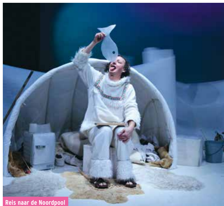
Reis naar de Noordpool