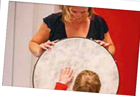
Do Re Mier