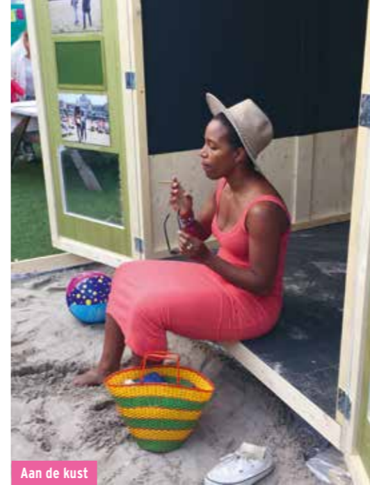
Aan de kust