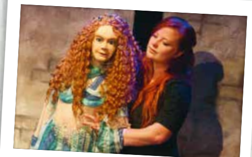
Romeo is op Julia & Tayla op Majnun

39.872 totaal aantal bezoekers & deelnemers